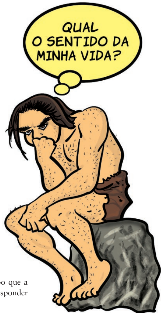
Figura 1.2: Já faz muito tempo que a humanidade se preocupa em responder a esse tipo de pergunta.